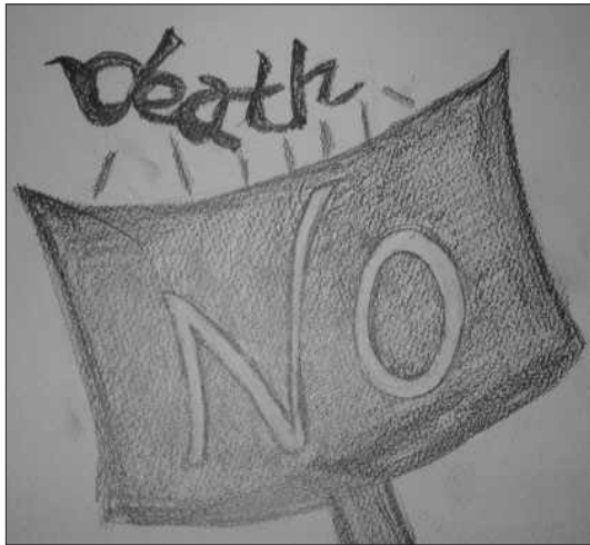
〈Figure 1〉 Barricade.