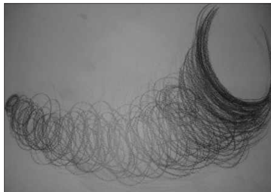
<Figure 3> Geometric pattern.

“말기 환자와 대화를 나눈 적이 있습니다. 그분은 자기에 다가오는 죽음의 그림자에 대해 인지하고 계셨고 담담히 그 운명을 받아