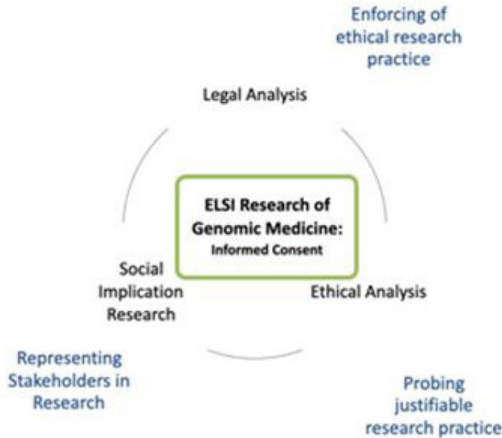
〈Figure 1〉 ELSI 센터 연구의 틀

한편, 이와 같은 분류를 맞춤의학에 적용했을 때 다음 <Table 3>과 같은 범주 설정이 가능했다. 이 범주는 PGM의 주요한 연구 방법에 수반되는